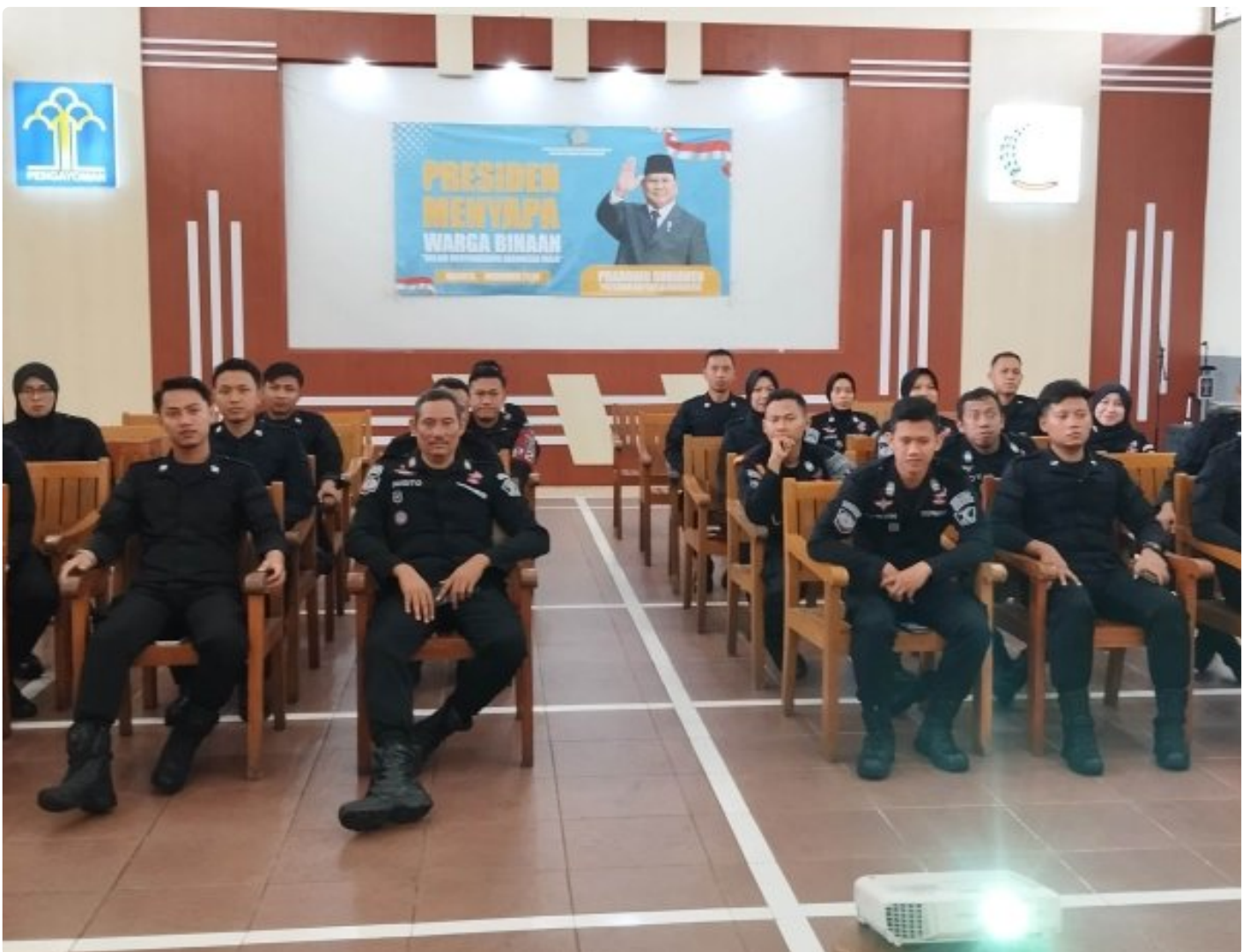
Rutan Blora Ikuti Sosialisasi Pedoman Uji Kompetensi Jabatan Fungsional Pembina Keamanan dan Pengaman Masyarakat

Blora - Rumah Tahanan Negara (Rutan) Kelas IIB Blora turut berpartisipasi dalam kegiatan Sosialisasi Pedoman Uji Kompetensi Jabatan Fungsional Pembina Keamanan Masyarakat dan Pengaman Masyarakat yang